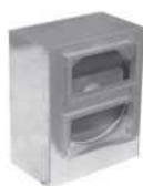
regenerační výměník s vysokou účinností do čtyřhranného potrubí