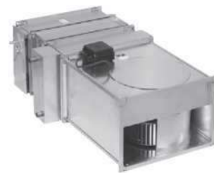
Krátká sestava, klapka, filtr G4, 2ř. vodní ohřivač, celková délka sestavy je 1200 mm.

Nepřehlédněte deskové křížové rekuperační výměníky tepla (viz příslušenství).