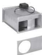
připojení na kruhové potrubí se dodávají přechody na kruhové potrubí, je nutno počítat se snížením průtoku o cca 15%